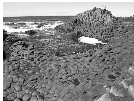
Abb. 2: «Giant's Causeway» (englisch für «Damm des Riesen» in Nordirland). Die polygonale Gesteinsstruktur entstand wahrscheinlich durch die Bildung von Konvektionszellen – die im Buch besprochen werden –, als das Gestein dort in flüssiger Form vorlag und beim Abkühlen strömte, während es sich verfestigte.

Die Wirkung der Wärme auf die Strömung (in den bisherigen Auflagen kaum erwähnt) nimmt nun ihren Platz unter den Urphänomenen der Strömung ein. Dieses Urphänomen zeigt sich an vielen Stellen in Natur und Technik: Wolkenbildung, Gesteinsbildung (dargestellt in dem sog. «giant's causeway» – Abb. 2 – Säulenbasalt in Nordirland), solare/stellare Granulationen, Trocknung von Schlamm sowie eine Vielzahl von Anwendungen in der Verfahrenstechnik (sog. Wärmetransport-Anwendungen).